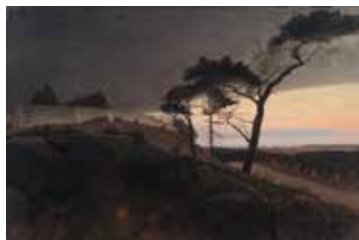
L.A. Ring: Efter solnedgang 1896

Søndag d. 26. Kl. 10.00, altergang 19. s.e. Trin.