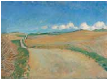
Karl Bovin: Landskab 1946

Søndag d. 14. Kl. 10.00, altergang 13. s.e. Trin.