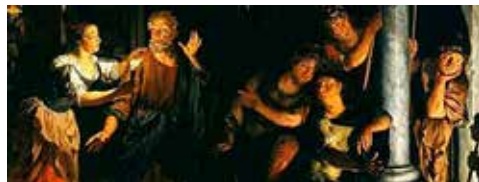
Nikolaus Knüpfer 1640: Peter fornægter Jesus