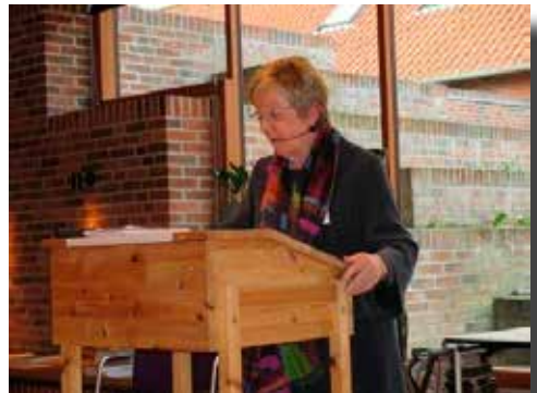
Kirkeminister Marianne Jelved på konferencen.

I slutningen af oktober eller begyndelsen af november vil vi invitere et medlem af arbejdsgruppen til "Forpagterboligen" ved Kegnæs Præstegård for at holde et oplæg om, hvordan kirken på landet kan bidrage til at skabe udvikling – til gavn for både kirken og lokalområdet. På grund af ferietiden har det ikke været muligt at træffe aftale med et medlem af arbejdsgruppen om en dato – det vil blive annonceret i lokalavisen.